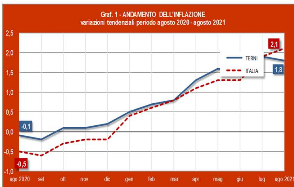
Grafico 1 - Andamento dell'inflazione.

Nel dettaglio dell'andamento dei prezzi su base annuale, Abitazione, acqua, elettricità e combustibili (+7,9%) e Trasporti (+4,9%) sono i capitoli che registrano l'inflazione più alta e ben al di sopra dell'indice generale. Rispetto ad agosto del 2020 le bollette hanno registrato una crescita molto sostenuta, in particolare quella del Gas ha evidenziato un incremento vicino al 35% e sostanziale è anche l'incremento su base annua della bolletta Elettrica (oltre il 13%). In crescita anche il prezzo dei carburanti e del trasporto passeggeri: in particolare si segnala l'aumento del costo del trasporto marittimo (+15,3% rispetto ad un anno fa), rincari che, hanno inciso sul costo degli spostamenti delle famiglie verso i luoghi di vacanza. Più cari rispetto ad agosto 2020 anche i soggiorni e pernottamenti in strutture ricettive e i pacchetti vacanze.