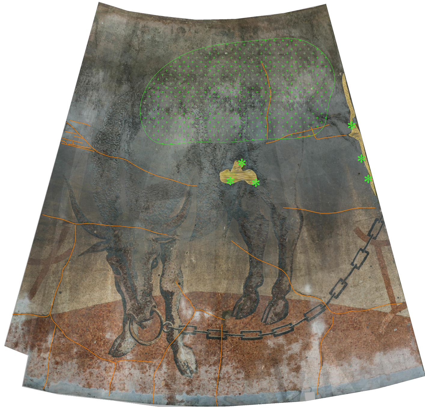
SCALA 1/25 0 0.50 1 m