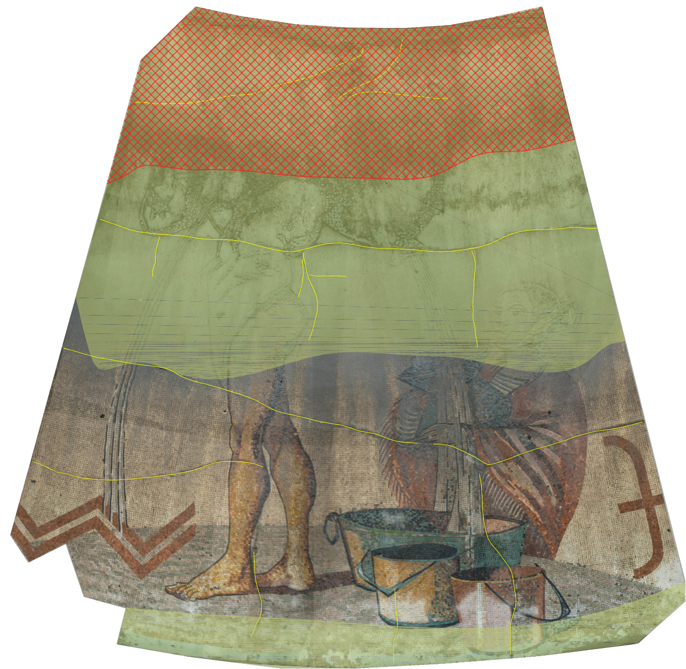
SCALA 1/25 0 0.50 1 m