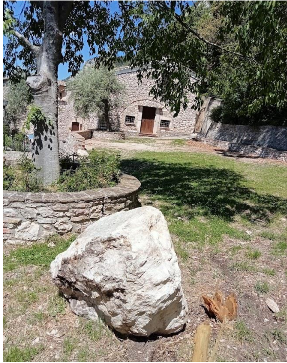
Masso distaccato e rotolato a valle