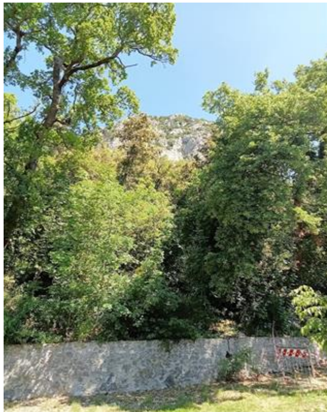
Carattere impervio della pendice di distacco