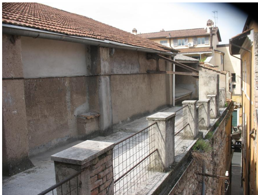
Ballatoio di copertura della sala.