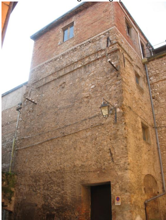
Volume uscita di sicurezza v. dell'Ospedale