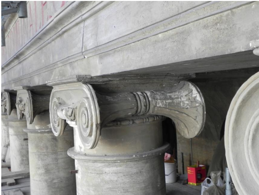
Pronao – trabeazione - capitelli