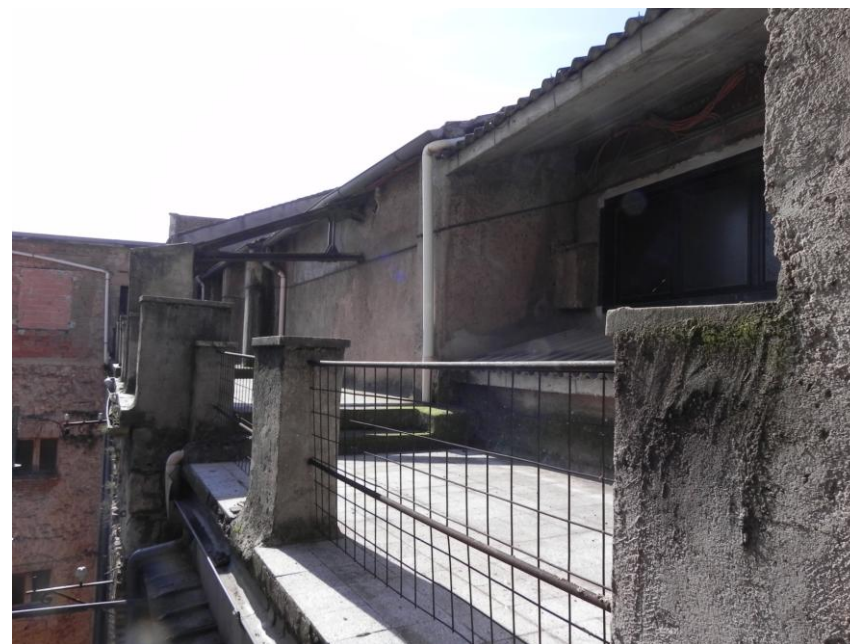
Ballatoio di copertura della sala.