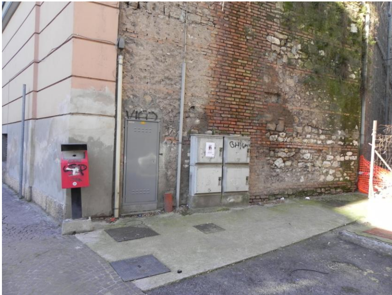
Lato dx L.go S. Agape.