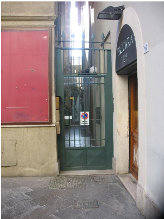
Accesso all'area privata dx