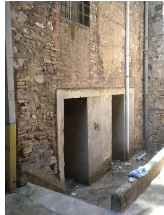
Uscite di sicurezza su v. dell'Ospedale.