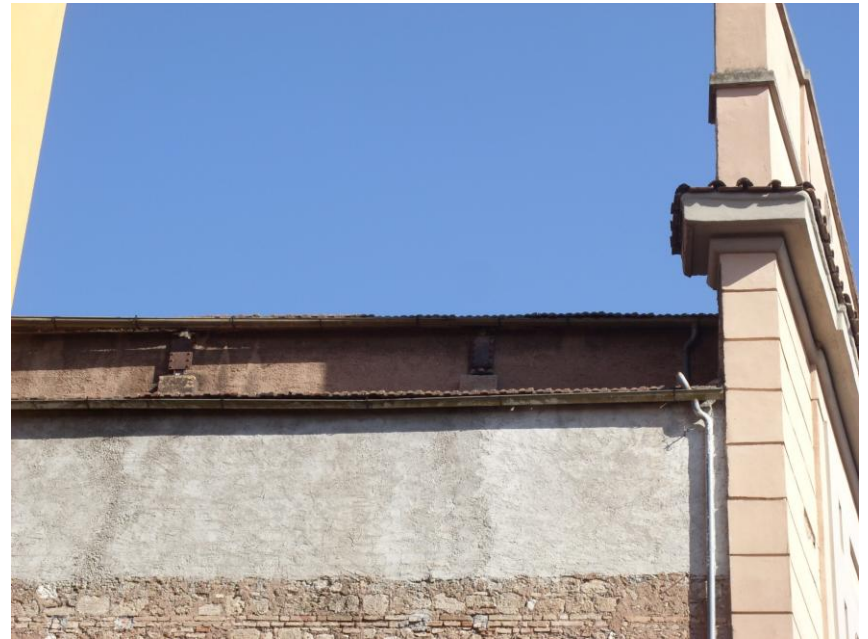
Facciata su L.go S. Agape.