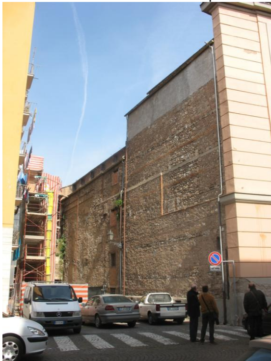
Laterale su L.go S. Agape.