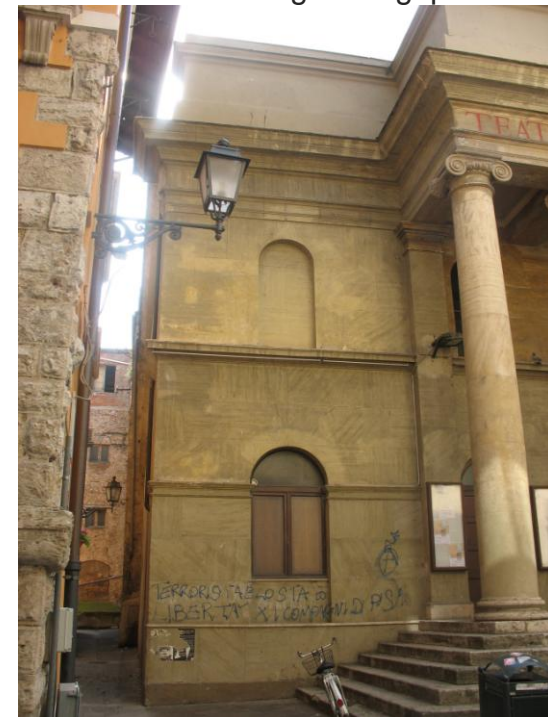
Laterale prospetto su C.so Vecchio