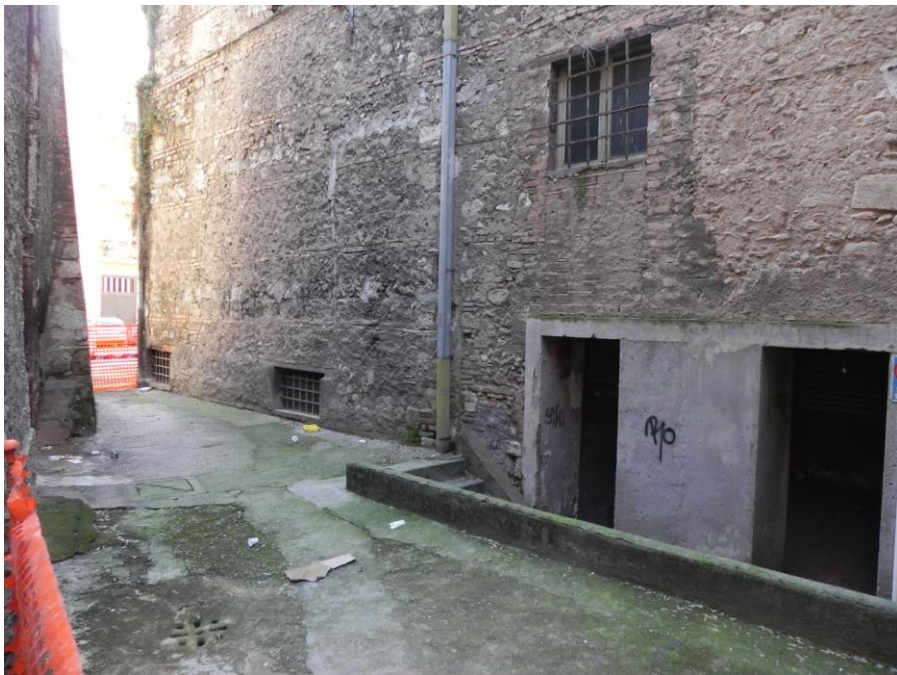
Uscite di sicurezza su v. dell'Ospedale