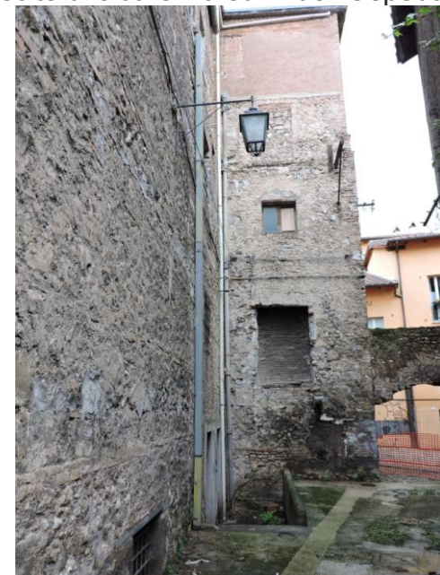
Volume uscita di sicurezza v. dell'Ospedale