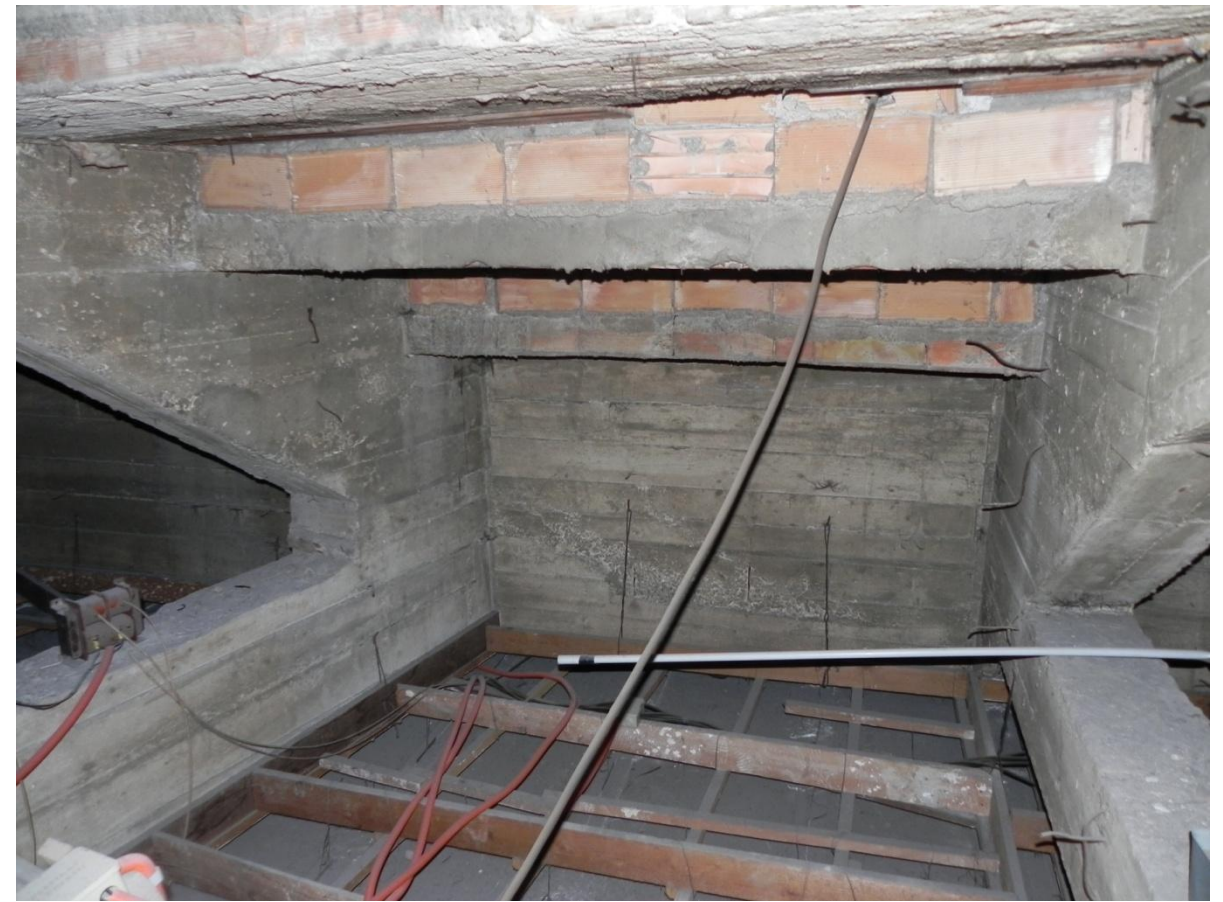
Struttura originaria prima galleria