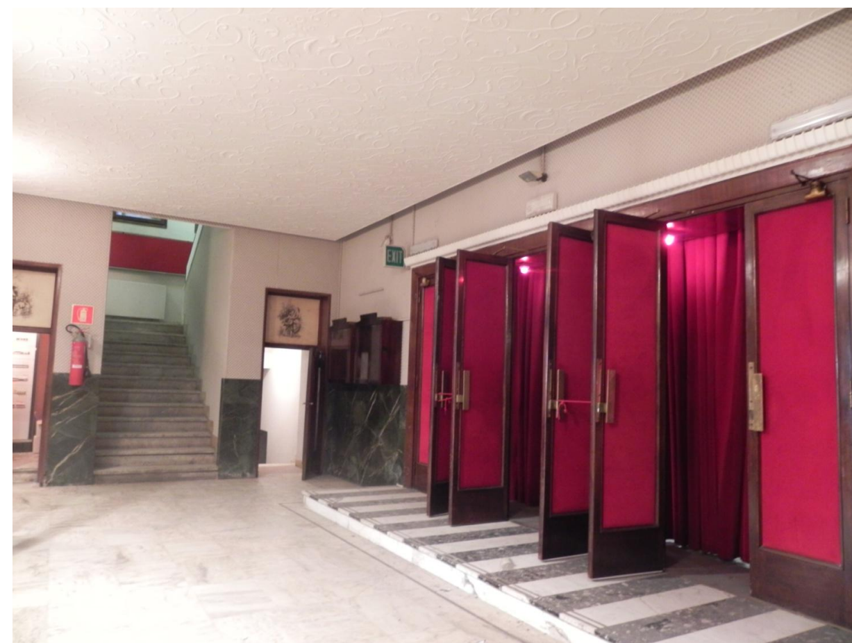
Accesso dal foyer alla sala