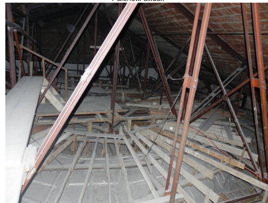
struttura del controsoffitto