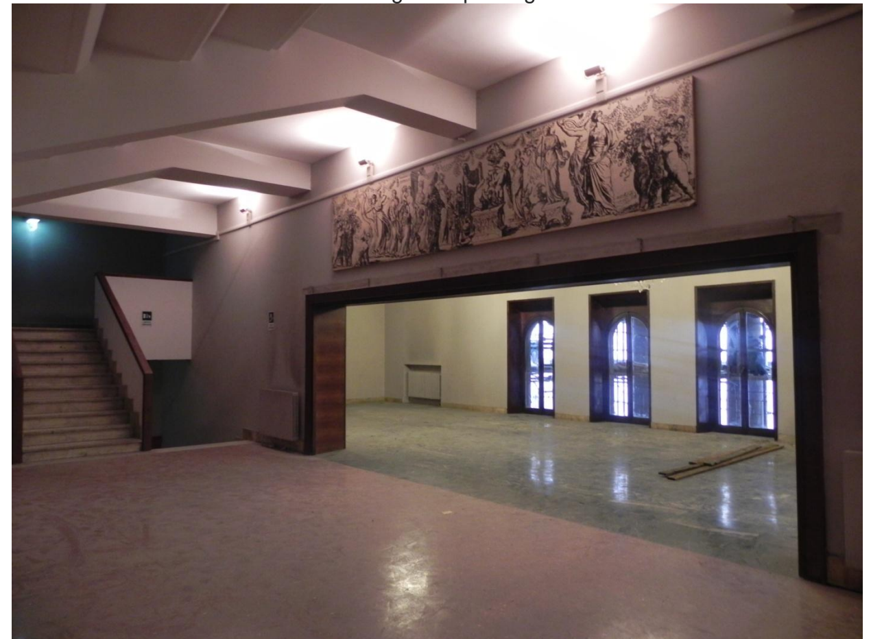
Vista dal foyer primo piano verso la sala degli specchi