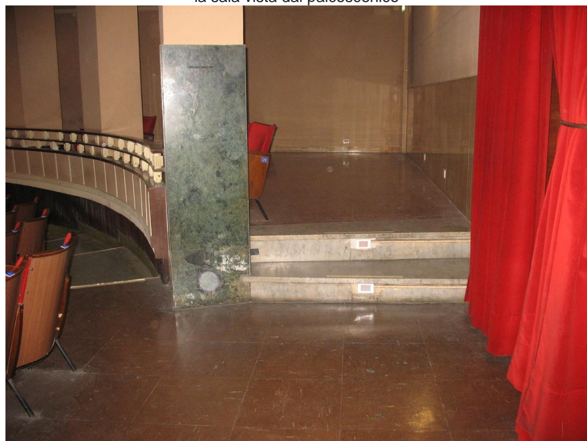
Accesso alla platea