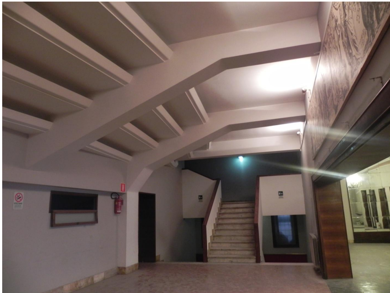
Foyer primo piano – struttura seconda galleria