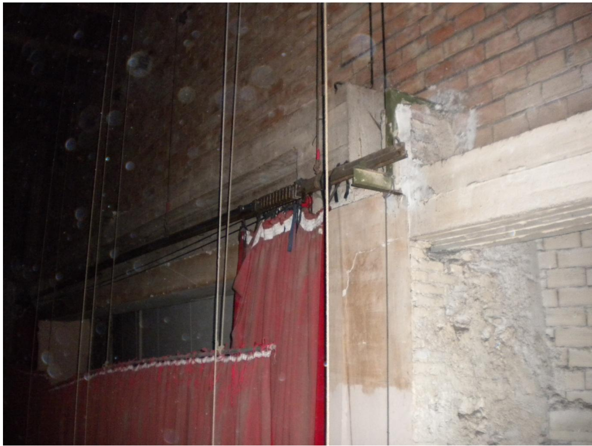
Portale strutturale tra la torre scenica e la sala