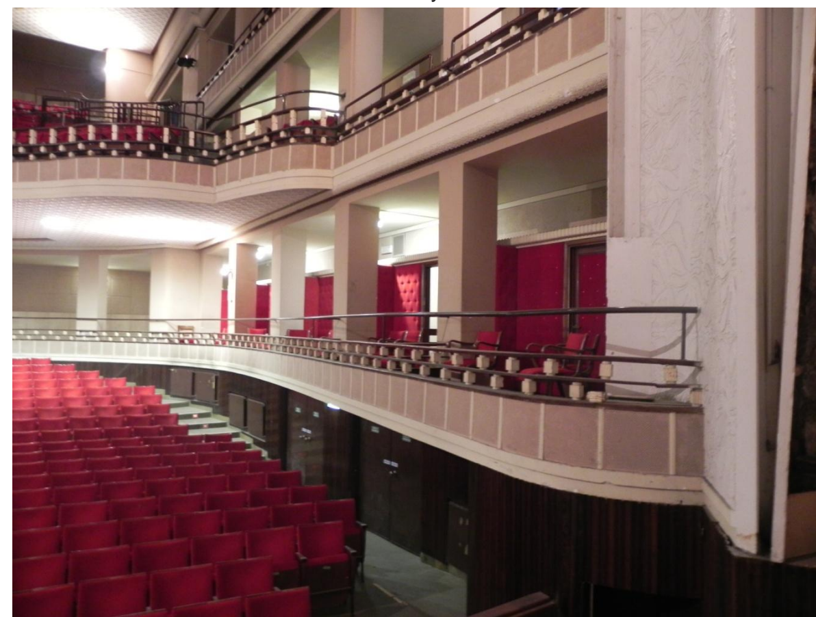
Palchetti laterali I e II ordine