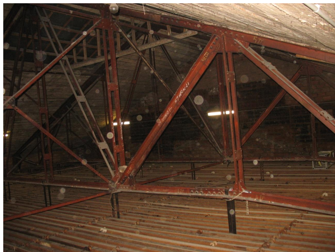
Struttura di copertura della graticcia della torre scenica