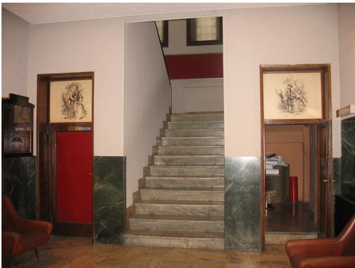
Accesso alla galleria dal foyer