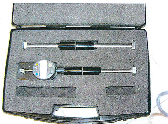
Fig. 3 il deformometro e comparatore digitale millesimale.