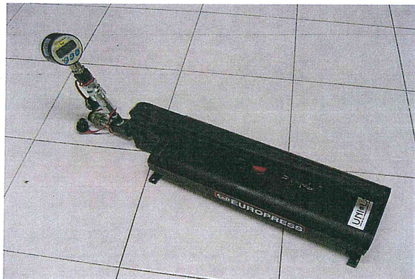
Fig. 2 pompa idraulica e manometro digitale div. 0,1 bar.