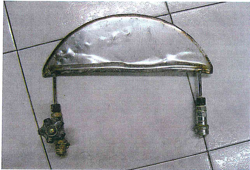
Fig. 1 martinetto piatto.